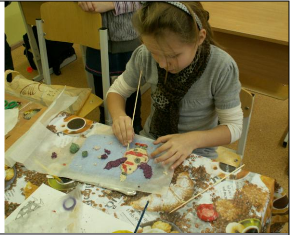
8 pav. Mokinė iš sūrios tešlos lipdo Renatos Šerelytės knygos „Kratatukų jūra“ personažus – kratatukus.