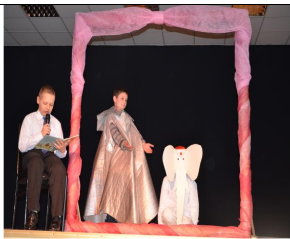
14 pav. Gyvasis paveikslas Baltasis Dramblys .