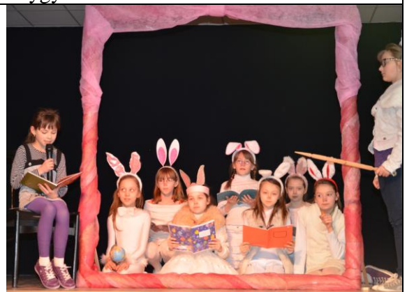
12 pav. Gyvasis paveikslas Kiškių mokykla .