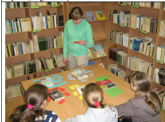
5 pav. „Alias“ žaidimas.