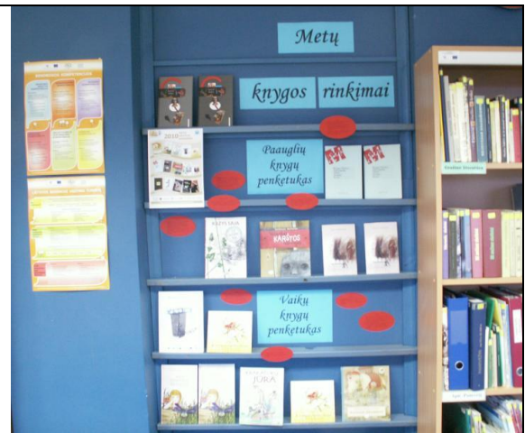
2 pav. Informacinis stendas bibliotekoje.