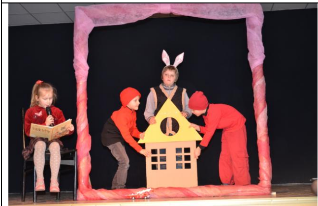
11 pav. Gyvasis paveikslas Kiškis Morkus Didysis .