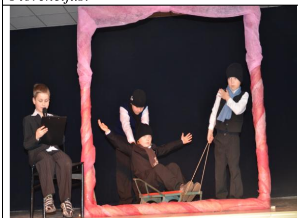
15 pav. Gyvasis paveikslas Pingvinai .