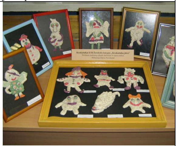
10 pav. Tešlainiukų paroda miesto knygyne.