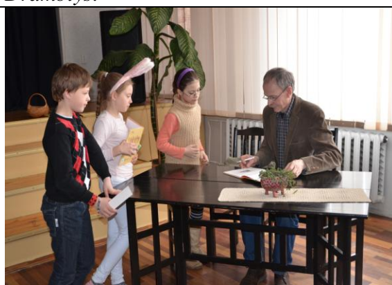
16 pav. Projekto baigiamojo renginio svečias rašytojas Kęstutis Kasperavičius dalija autografus.