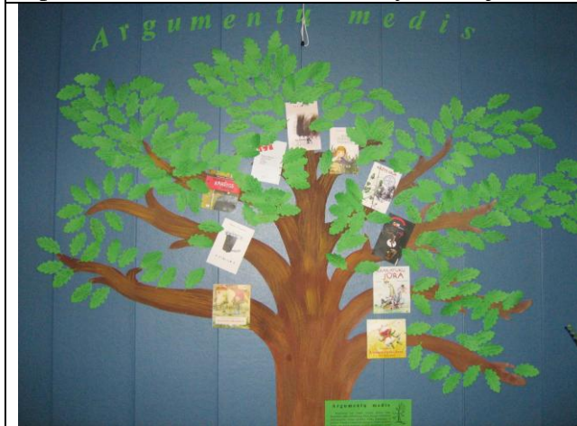
3 pav. „Argumentų medis“.