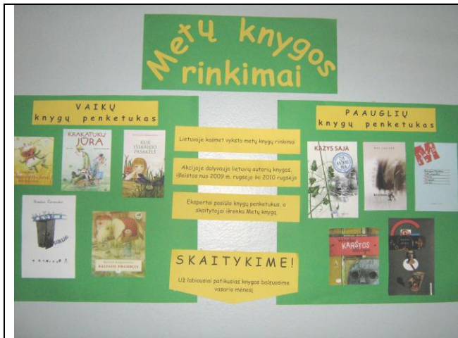
1 pav. Informacinis stendas mokyklos fojė.