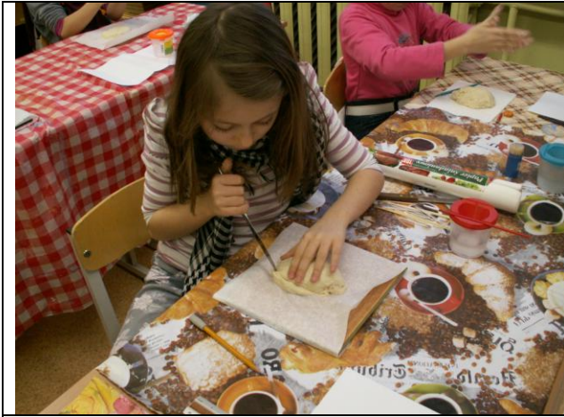
7 pav. Mokinė iš sūrios tešlos lipdo Renatos Šerelytės knygos „Kratatukų jūra“ personažus – kratatukus.