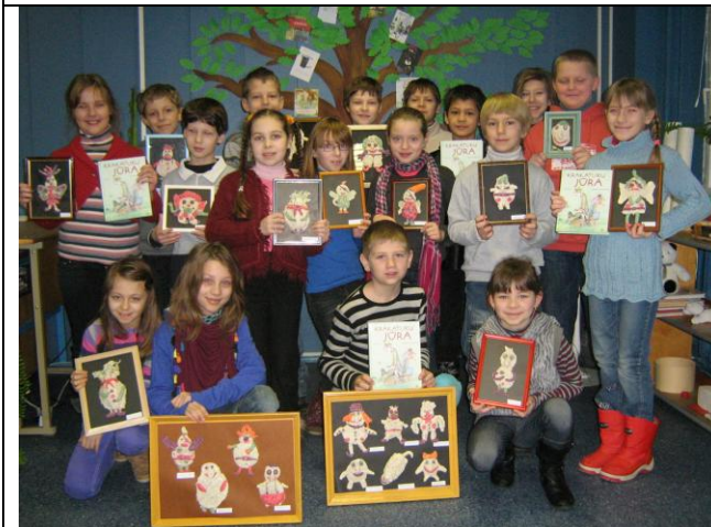
9 pav. Tešlainiukų paroda mokykloje.