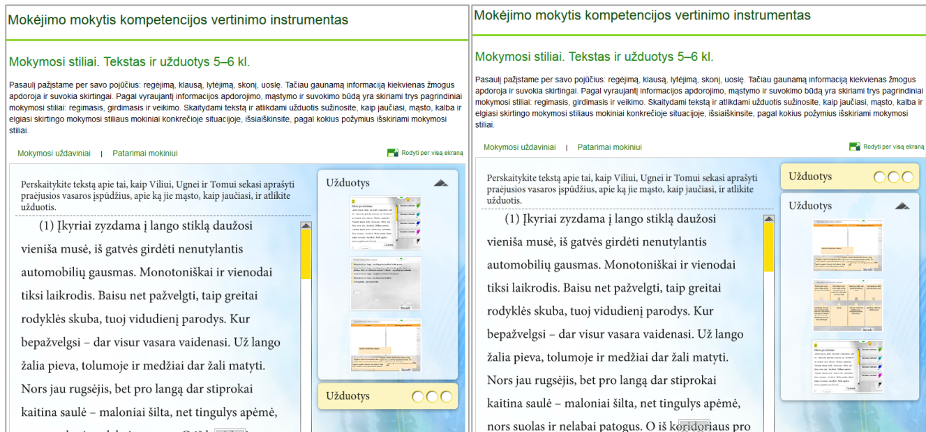
1 pav. MO tekstas ir užduotys 5–6 klasei.

Pasirinkus užduotį spustelint piktogramą, ekrane pasirodo pradinis užduoties langas su išskleista užduoties formuluoote (žr. 2a pav.). Perskaičius užduotį, reikia spustelėti žalią trikampį mygtuką, kad užduoties formuluoatė susiskleistų ir būtų galima matyti visą užduotį (žr. 2b pav.).